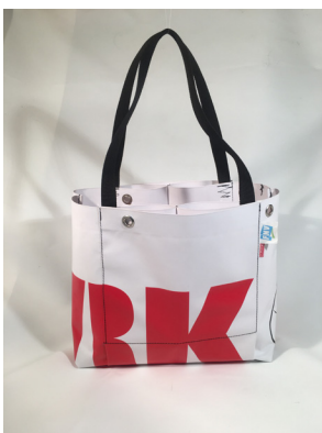
# FNV collectie gemaakt van gerecyclede banieren van FNV acites. In op- dracht van FNV