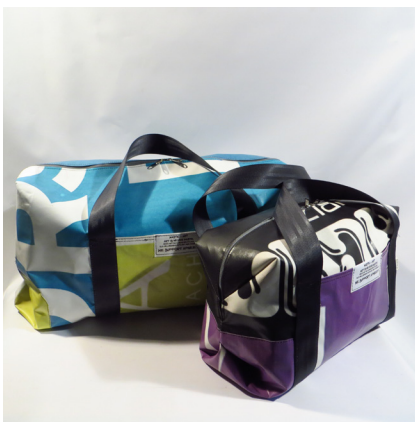
# IBIBAG collectie gemaakt van gerecyclede reclame banieren van Ibiza