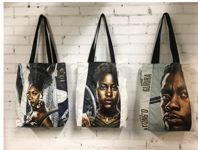
# VUE CINEMA gemaakt van gerecyclede DISNEY filmba- nieren. In opdracht van VUE cinema