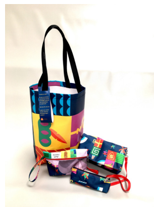
# GEMEENTE ZAANSTAD collectie gemaakt van gerecyclede banieren van de intocht van Sin- terklaas. In opdracht van Gemeente Zaanstad