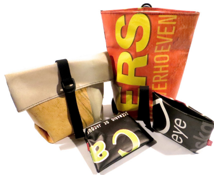
# EYE collectie gemaakt van gerecyclede- filmbanieren